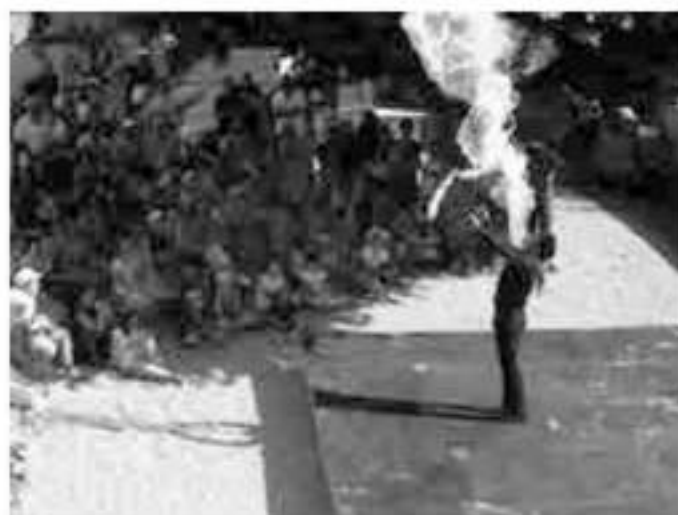
Le cracheur de feu...