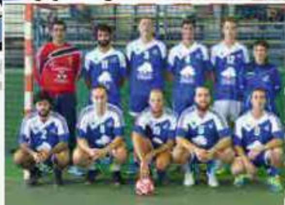
Seniors garçons 1