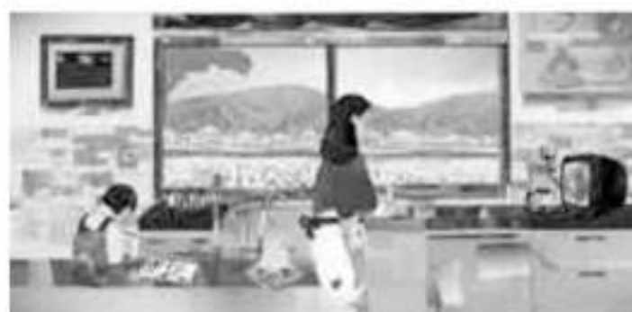
In the kitchen with a big window 2014