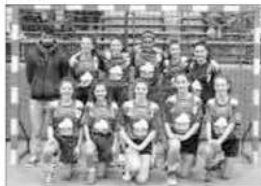
Equipe -17 ans filles