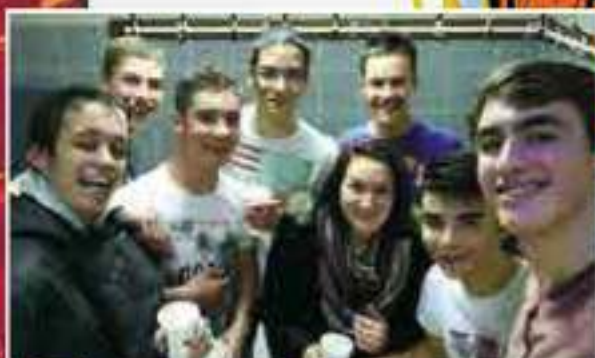
-17 ans garçons