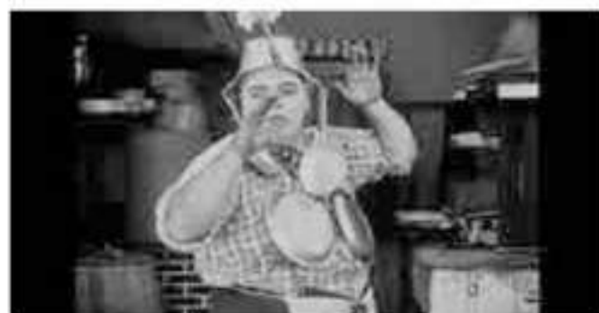
Fatty cuisinier 1918