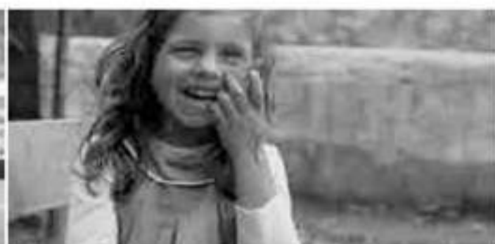
Bende Sira 2007