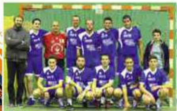
Seniors garçons 2