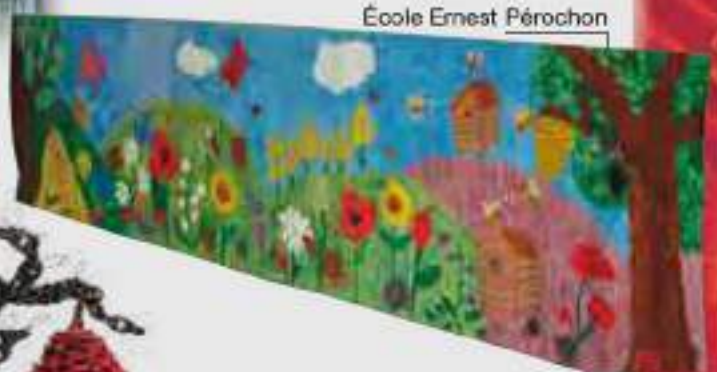
École Ernest Pérochon