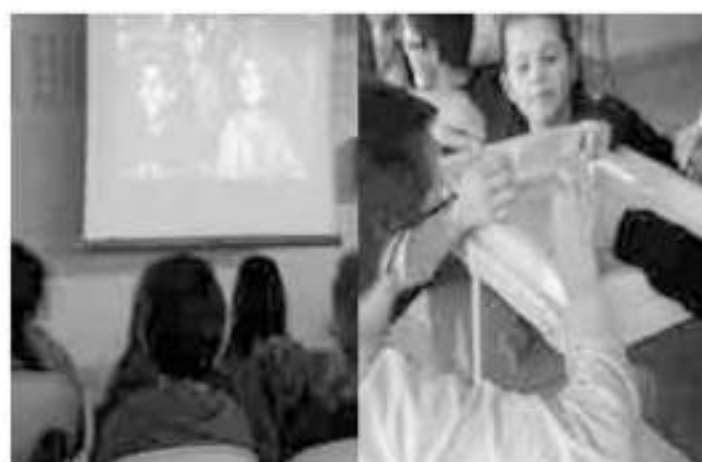
Un jury très sérieux !

Le 15 décembre, comme chaque année, l'espace du midi était le lieu de projection de courts métrages. Cette fois, les parents étaient invités à visionner les lauréats du festival durant la soirée. La sélection 2016 : "Fatty cuisinier" pour le cycle 2, "Bende Sira" pour le cycle 3 et "In the kitchen with a big window" pour les enseignants.