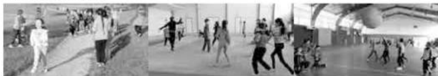
La classe de CM1 avec l'école de Cirières.