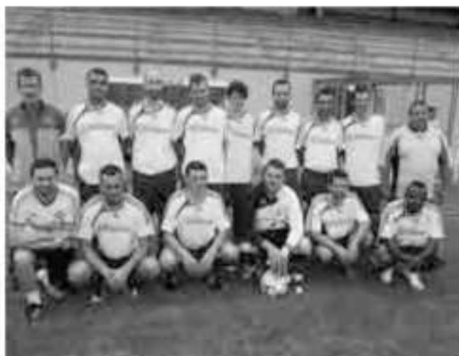
La RA, 11ème, va devoir batailler pour se sauver.

Il serait vain de se voiler la face, les réserves avec un effectif appauvri par de nombreux départs, des jeunes très prometteurs surtout, obligent les coaches Fuzeau et Lambotte à "jongler" chaque week-end; difficile donc de trouver équilibre et stabilité. La trêve semble la bienvenue pour réparer tous les bobos afin de repartir avec toutes nos forces vives car il y en a . Il faudra avant tout faire jouer l'esprit club et que chacun donne le meilleur de lui-même pour faire honneur à nos couleurs, Chapia... Bâtin... Coutia... Y sé d' Courly... Non !!!