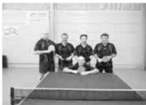
L'équipe 1 - Régionale 2