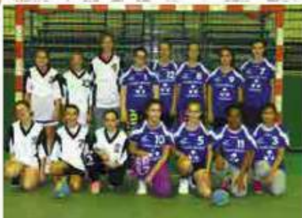
-13 ans et -15 filles