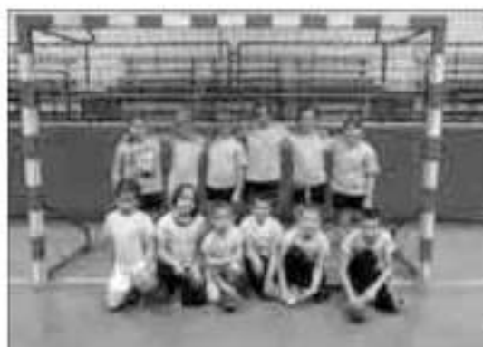
Equipe -11 ans filles et garçons