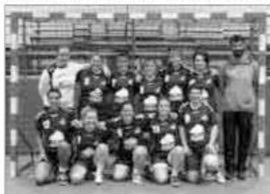
Equipe sénior filles

Dates à retenir : Le loto du club aura lieu le dimanche 15 Janvier 2017 à la salle des fêtes de Courlay et le tournoi sur herbe aura lieu le vendredi 9 Juin 2017 au stade municipal de Courlay.