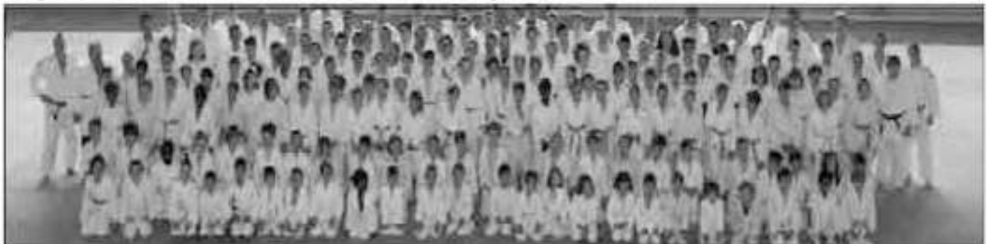
Le JCBB : une grande famille de plus de 450 licenciés

Pendant les vacances scolaires, nos jeunes judokas ont la possibilité de participer à des stages permettant de réunir chaque classe d'âge du club.