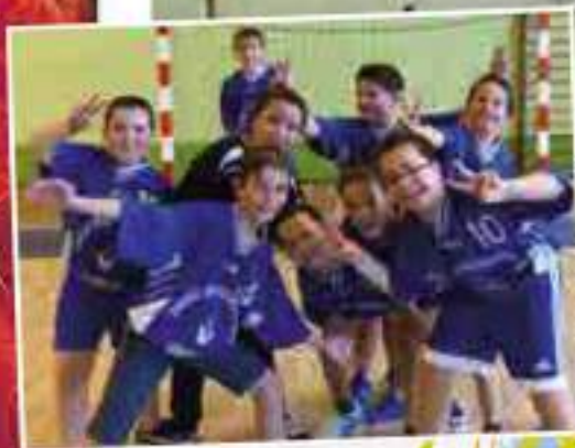
-13 ans garçons