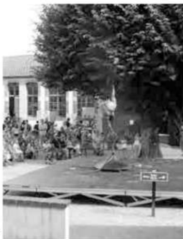
Loïc sur son mât chinois...

Depuis 2015, l'été à la Tour Nivelle est aussi synonyme de sciences grâce au partenariat avec l' Espace Mendès France de Poitiers .