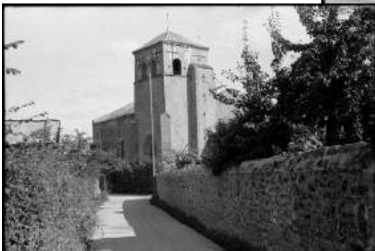
Le clocher de l'église Saint-Rémi (Août 1945)...