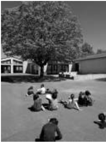
Dessin d'observation de l'arbre de la cour au printemps

Les CE1 poursuivent leur travail autour des 4 saisons à travers différentes activités :