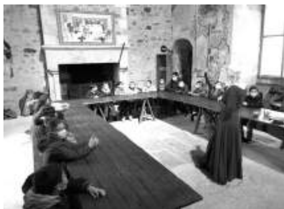
Dans la grande salle du Château

Les personnes les mieux considérées sont placées près de la cheminée pour profiter de la chaleur et d'une meilleure luminosité !