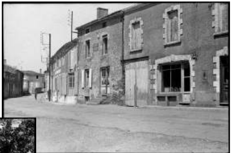
Le bourg, avec le café GORRY (Août 1945)...