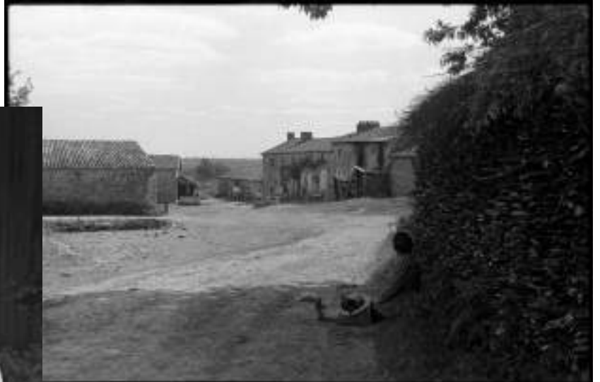
Une ferme de Courlay (Août 1945)...