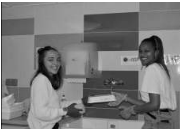
En pleine action, deux jeunes demoiselles à l'école maternelle...