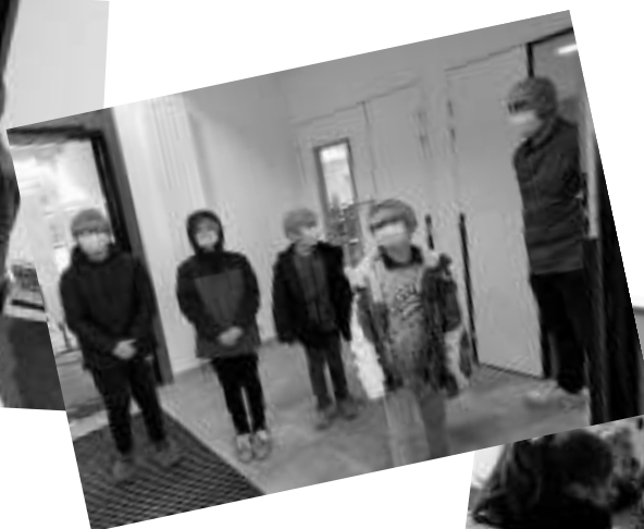
Équipés pour la visite de la cuisine...