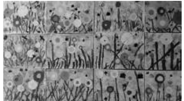
Arts plastiques : la prairie fleurie