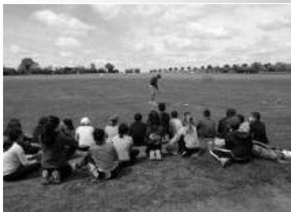
Au vrai golf de Bressuire...