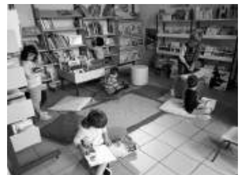
Le temps de lecture-plaisir...