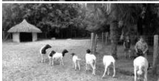
Aménagement de notre prairie...