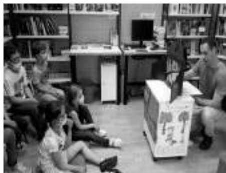
L'heure du conte...