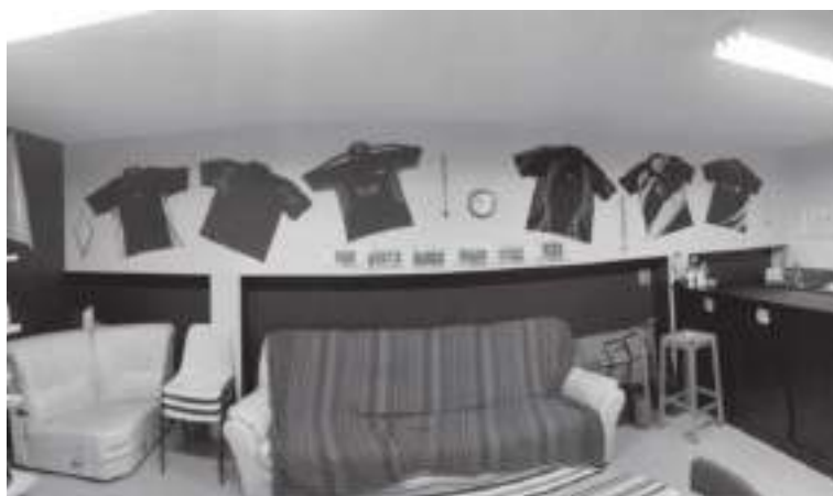
La déco du club-house a été revue, avec notamment la mise en valeur des différents maillots portés lors des dernières saisons.