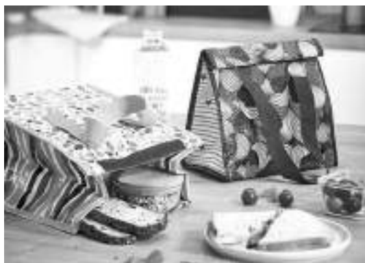
Objets en vente à Noël (gourdes, lunch bag, porte-clés, ...)

Les deux ventes organisées dans l'année ont été bien suivies par les familles :