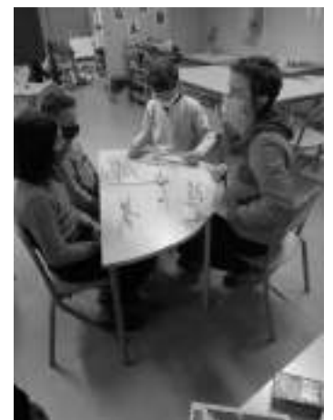
Jeux de société...