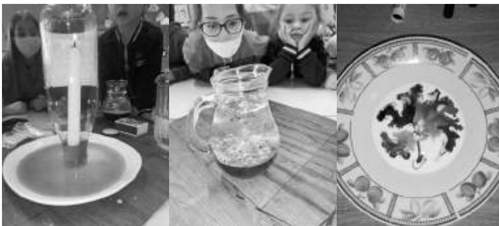
Petites expériences de physique amusante...