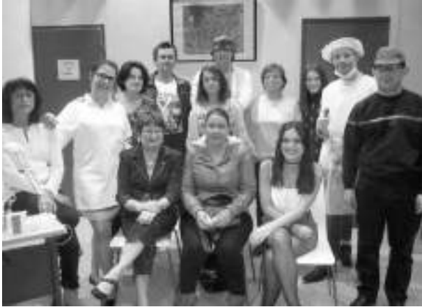
Sale attente (2016)