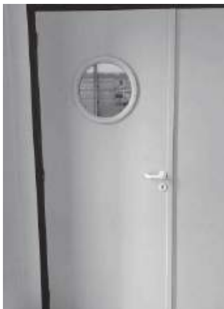
Un hublot a été posé par les services de la commune sur la porte pour éviter d'entrer et perturber les parties "en cours".

Nous savons la déception de nos licenciés qui ne peuvent pas pratiquer leur sport. Quelques "hommes de l'ombre" ont passé un peu de leur temps à préparer la salle pour la saison à venir.