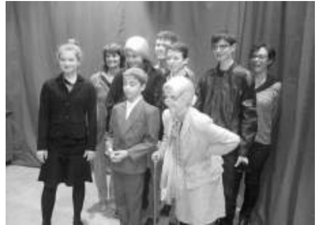
Fugue en duo majeur (2016)