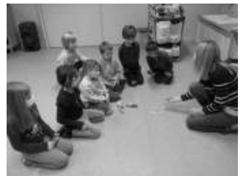
Jeux d'autrefois, les osselets...