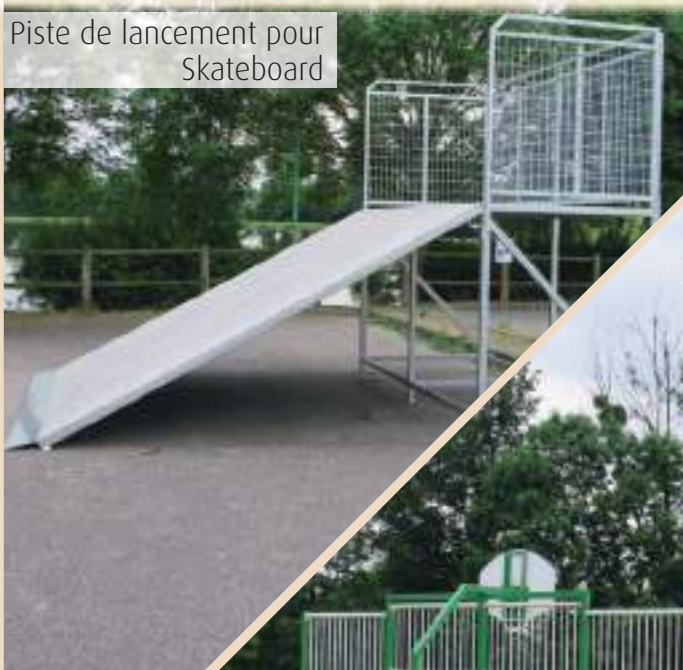
Piste de lancement pour Skateboard

Avec la participation financière du Conseil Départementale (5000 € par projet)