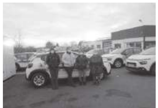
Quelques salariées lors de la réception des voitures

Au cours du mois de janvier, le remplacement des voitures de service mises à disposition par la fédération départementale s'est effectué pour une nouvelle période de 2 ans.