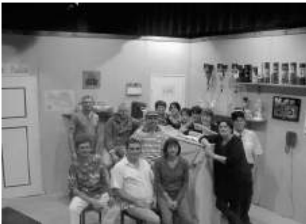
Larguer les amarres (2010)