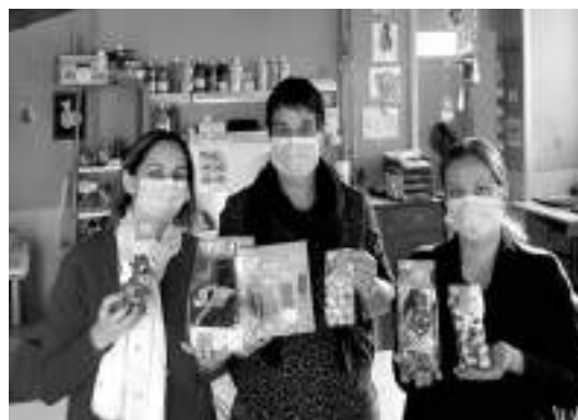
Chocolats de Pâques

Les ventes nous auront servies à financer les sorties de fin d'année de la Petite Section au CM2.