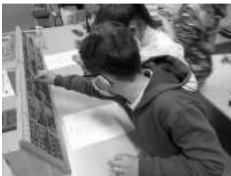
Imprimerie scolaire et linogravure...